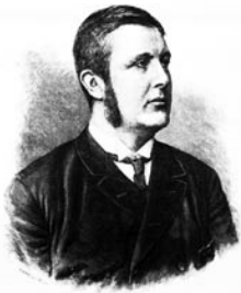
Wekerle Sándor (1848-1921)